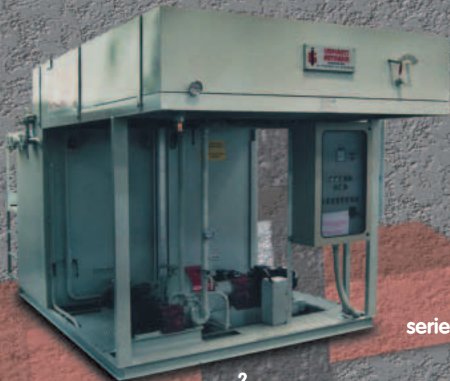
serie "COMPACT 3000"