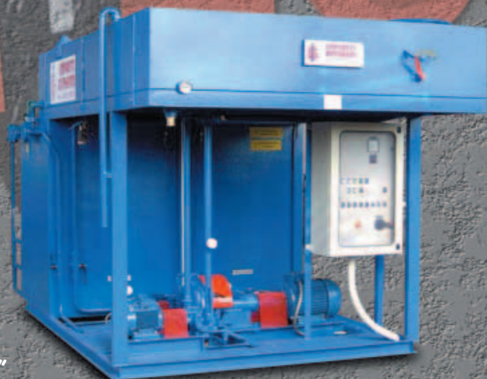
serie "COMPACT 5000"